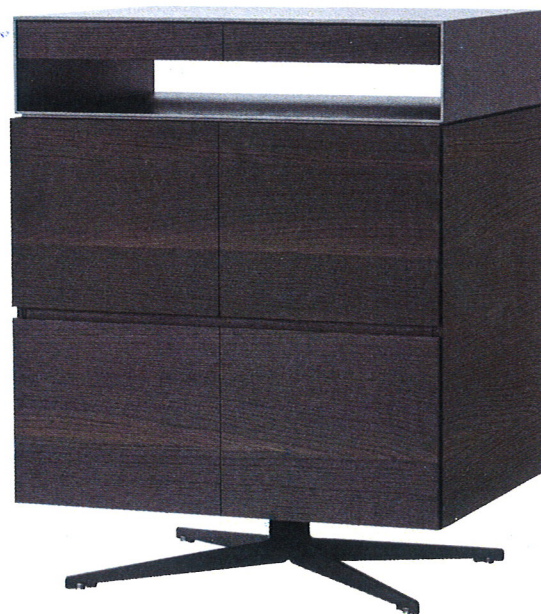
Cabinet "Steward". Lema (2016)