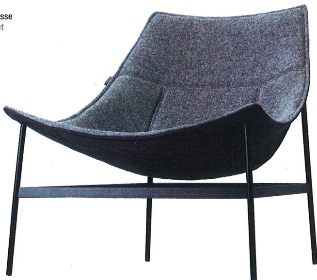
Fauteuil "Montparnasse Easy", Offect (2016)

Il a appris chez Philippe Starck que le travail du designer est de raconter des histoires, qu'il faut révéler le beau et l'émouvant dans l'ordinaire. Rocker à peine contrarié, il porte sa silhouette avec assurance du monde du design au monde de l'architecture, deux mondes parallèles, livrant des chantiers d'hôtels comme le Pullman de la Tour Eiffel avec son restaurant Frame (France Amérique), des villas privées ou des espaces de bureau évolutifs travaillés, avec clarté d'expression et économie du trait. C'est presque dans le registre de la ligne claire que l'on rangerait le designer. A l'écoute de son commanditaire, il ne se laisse pas aller aux fioritures et va droit au but. Le mobilier, il le veut pour tous. Il signait la première collection d'extérieur pour Truffaut en 2014.