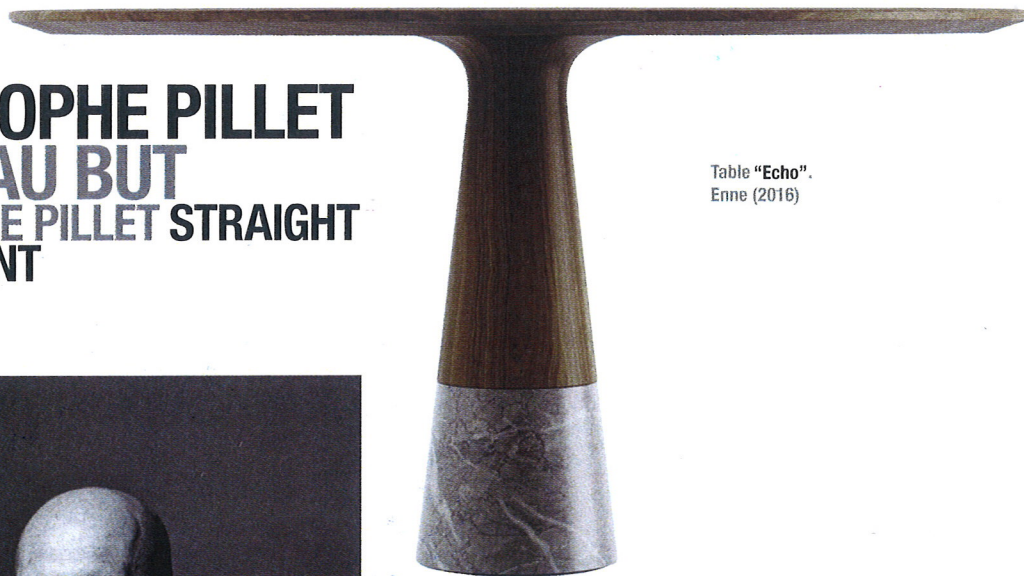
Table "Echo". Enne (2016)